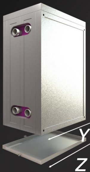
ISOLATION Hauteur 942 mm Largeur 434 mm